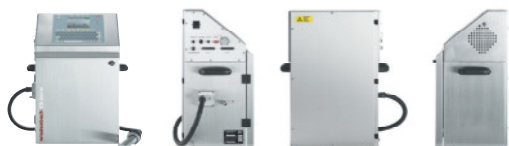
CS Serie Contrast & Speed

Inkjetdrucker für Farbstoff- und leucht pigmentierte Tinten